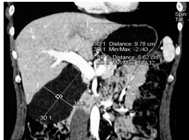
Fig. 1 - Ricostruzione TC che evidenzia i rapporti della neoformazione con le strutture adiacenti.

Il LC, descritto per la prima volta da Rodenberg nel 1828 (12), è una rara lesione che origina dal sistema linfatico. L'incidenza è molto bassa, pari a 1/12.000 nascite (13): il 75% di tali formazioni insorge nel collo, il 20% nella regione ascellare e il rimanente 5%, con frequen-