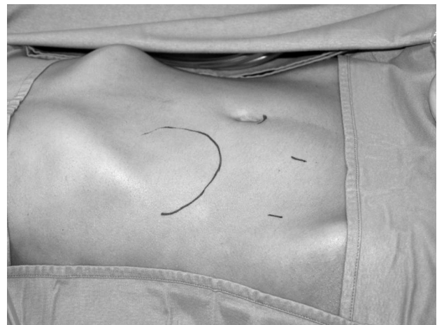
Fig. 2 - Individuazione della posizione dei trocars rispetto alla lesione.