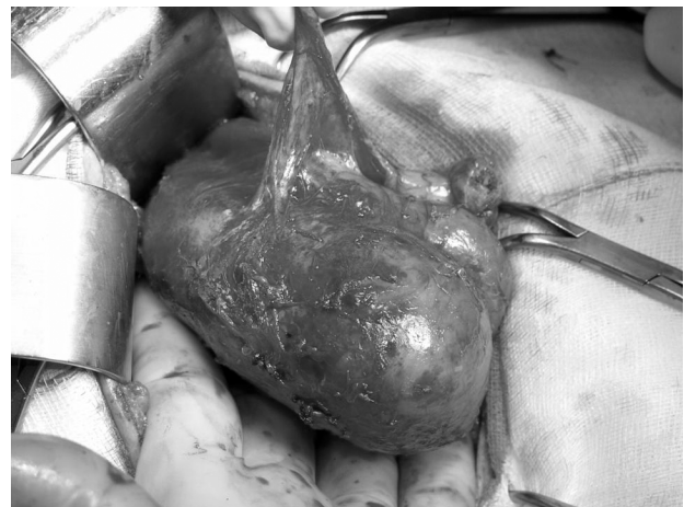
Fig. 3 - Pezzo operatorio.